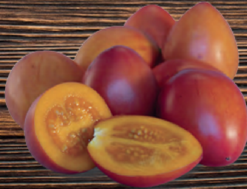
tomate de árbol