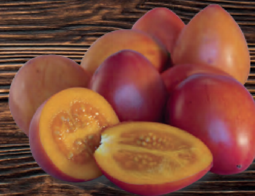
tomate de árbol