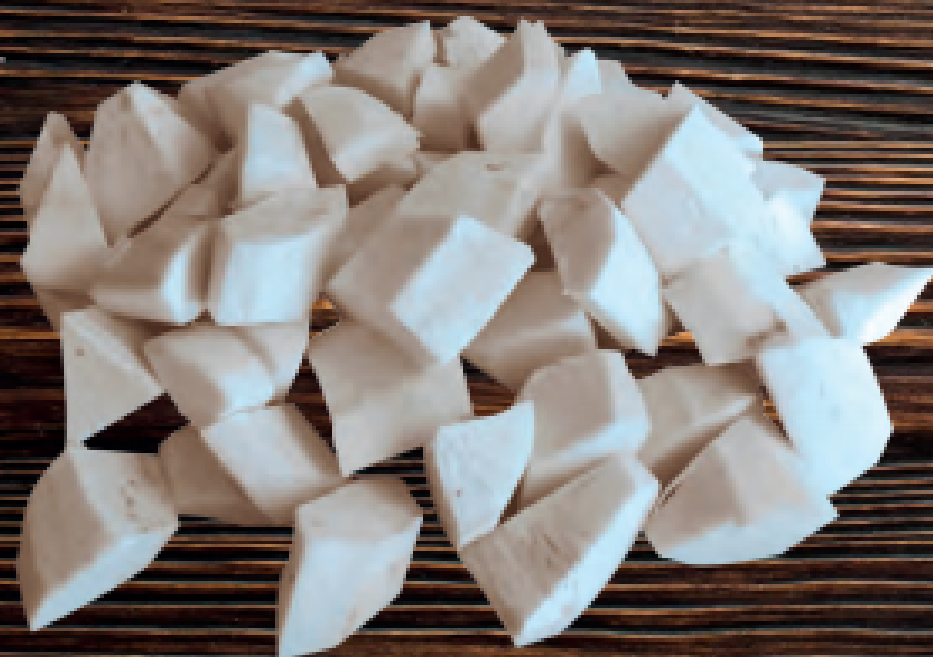
yuca en trozos